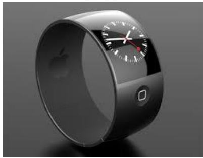
新しいものって常に 古いものを踏襲しているものなのです

4月。新しい年度のスタートです。これを期に仕事でも勉強でもスポーツでも、新しいことを始めようって人は多いんじゃないでしょうか。